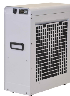
ProfiCool Primus PCPR 020