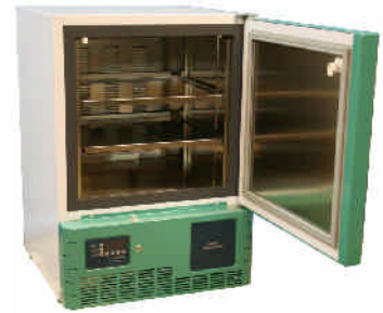
LabStar Sanguis LSSA1105EWU