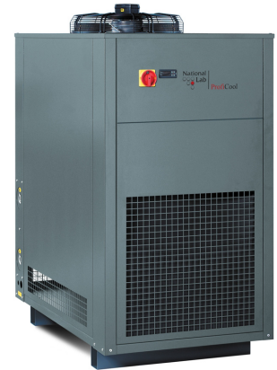
ProfiCool Genius Zero (mit Option Sonderfarbe RAL 7043, verkehrsgrau B)