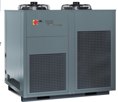
ProfiCool Genius Zero (mit Option Sonderfarbe RAL 7043, verkehrsgrau B)