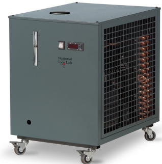
FlowCool Unicus (mit Option Rollen)