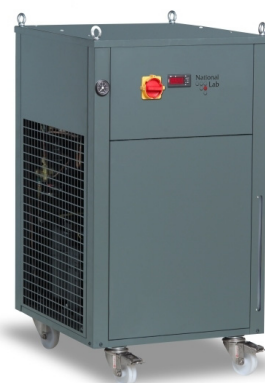
FlowCool Unicus (mit Option Rollen)