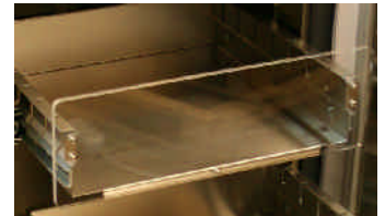
Schubladen mit Teleskopauszug