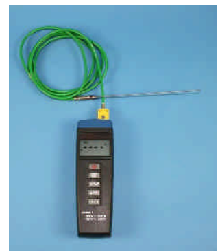
MIN/MAX Thermometer mit zusätzlichem Temperaturfühler