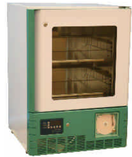
LabStar Sanguis LSSA1104GEWU