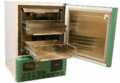
LabStar Sanguis LSSA1125EWN