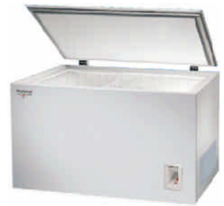
ProfiLine Pollux 3645WN